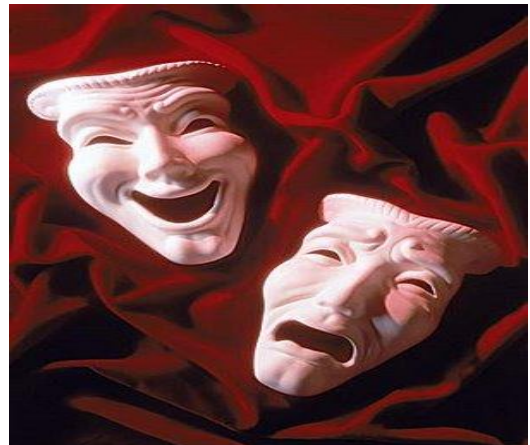
Grieks lachend en huilend mask

Romeinen waren helemaal gek van toneel en dans, daarom gingen ze vaak naar het theater. De keizers van Rome gingen meer doen met het orkest in het theater maar omdat de dans daardoor niet meer opviel, kregen de dansers een stukje metaal onder hun schoenen. Hierdoor is dus het tapdansen ontstaan! Het Romeinse Rijk heeft weinig grote toneelschrijvers voortgebracht.