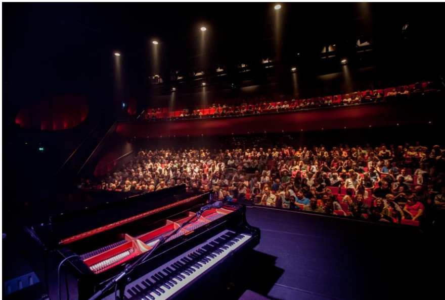
Theater het Kruispunt

Theater het Kruispunt heeft ongeveer 100 voorstellingen per jaar, in verschillende genres. Die genres zijn: cabaret, toneel, dans, muziek(theater), toneel, musical, show en jeugdvoorstellingen. Naast voorstellingen is bijna elke week ook een film te zien.