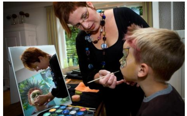
Een grimeur aan het werk